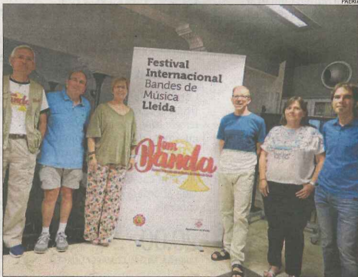
Presentació ahir de la nova edició del festival Fem Banda.

El festival comptarà amb la participació de la Banda Simfònica de Reus, la Banda Simfònica de Roquetes-Nou Barris de Barcelona, l'Agrupació Musical Iniestiense (Conca), l'Agrupació Musical l'Alcalatén de l'Alcora (Castelló), la Banda de Música de Épila (Saragossa), l'Orchestre d'Harmonie de l'Union de Tolosa (França) i la Uniao Filarmonica do Troviscal (Portugal), a més de la