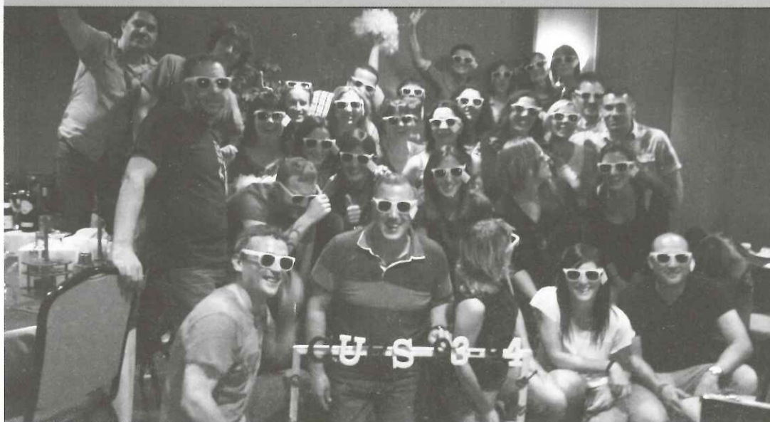
CERVERA.- Després de 26 anys sense veure's, els exalumnes del col·legi Jaume Balmes de Cervera, del curs 93-94, van retrobar-se el passat 10 de juny, per visitar el centre plegats i compartir un sopar ple d'emocions i records.