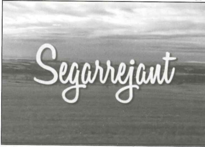
Captura de pantalla dels crèdits d'entrada del vídeo

Una altra característica destacada del videoclip seria "les sinèrgies que s'han creat amb els diferents ajuntaments de la comarca, perquè alguns municipis tenen cabuda en aquest vídeo, mentre que la resta sortiran en una segona edició", segons s'ha expressat des de l'Àrea de Turisme, afegint que amb aquestes "sinèrgies", el que és pretén és "que els ajuntaments facin seu el vídeo i el comparteixin als seus canals de comunicació, web i xarxes, i tots plegats portin