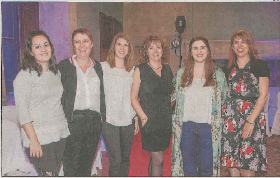
Les dissenyadores en una fotografia de família.