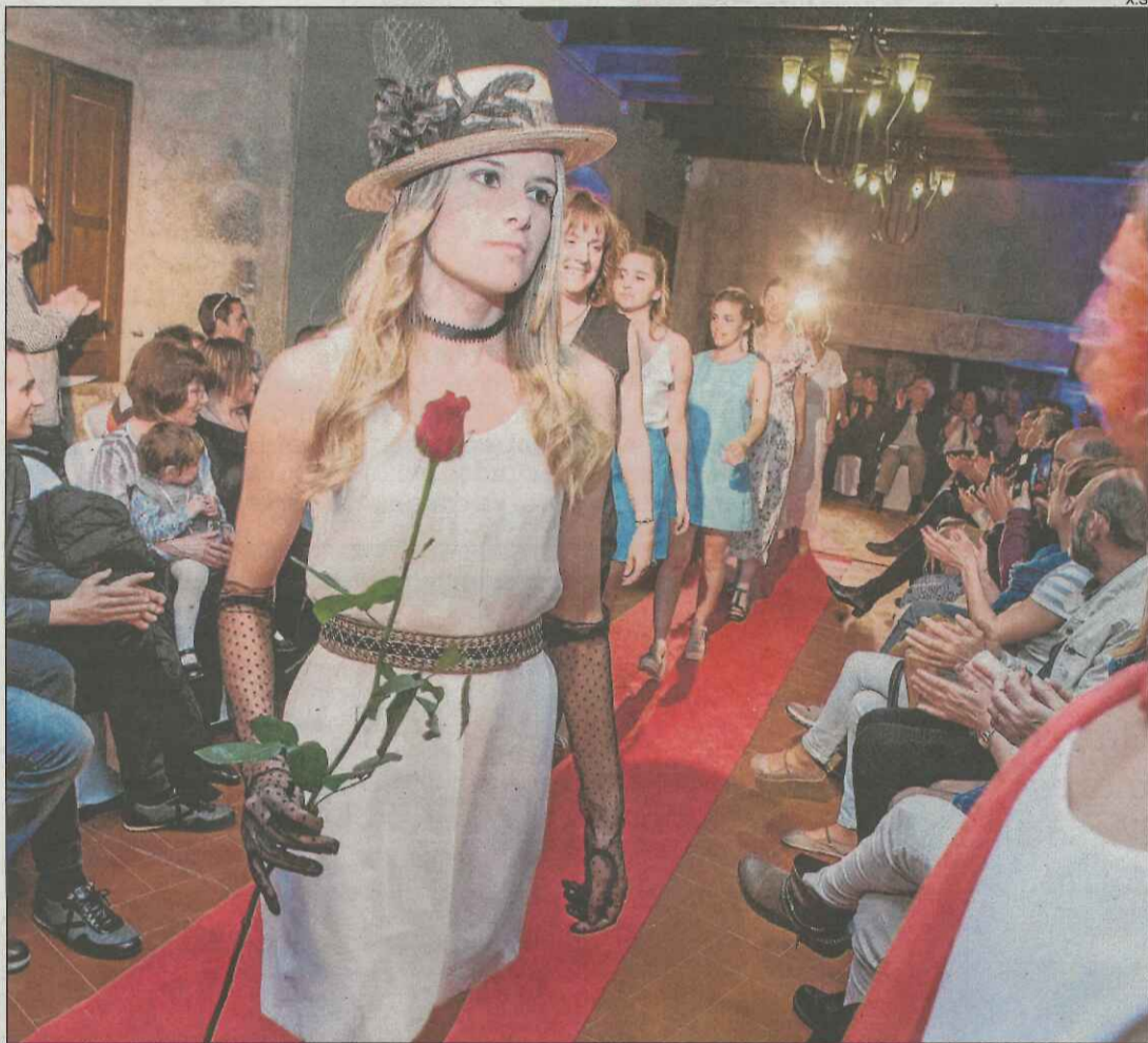
La desfilada final amb les quaranta models que van participar en el muntatge.0