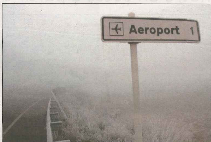
La boira ha afectat l'Aeroport molts dies aquest mes