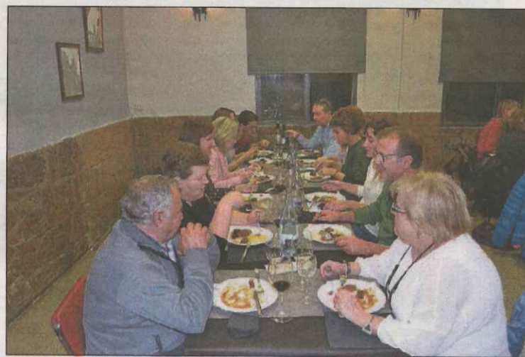
El menú de degustació estava adaptat a les Jornades

Les III Jornades Gastronòmiques de la Segarra estan sent un èxit de públic. Ahir, el Restaurant la Mallola de Sanaüja va projectar un Sopar de maridatge amb el Celler Comalats que va comptar amb una vintena de persones. Es va oferir un menú amb un preu molt accessible.