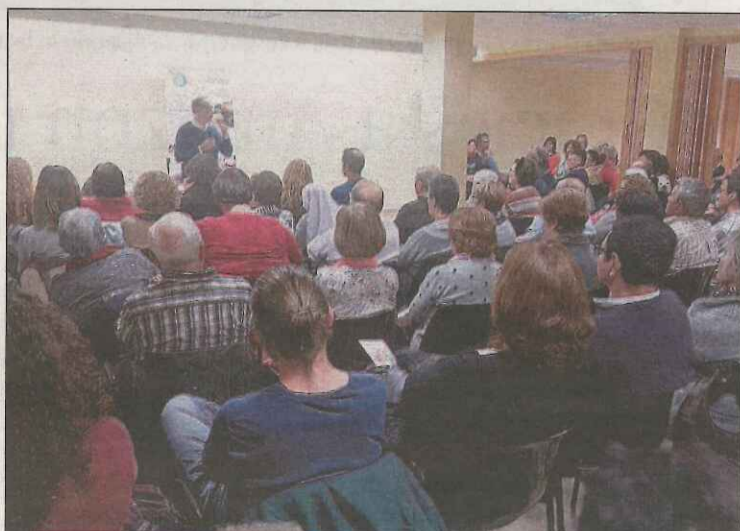
La Biblioteca de Tremp es va omplir de gom a gom

El mediàtic filòsof teòleg i escriptor va plantejar als assistents la necessitat de repensar la felicitat per tal de millorar la nostra salut emocional i mental.