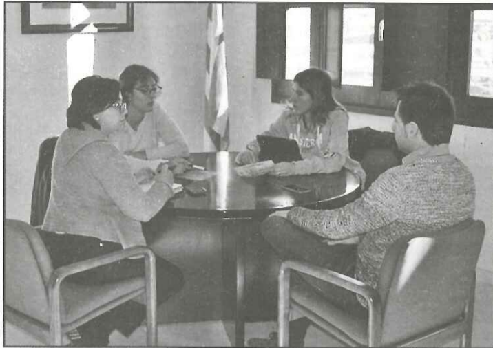
Imatge de la trobada mantinguda a la seu del Consell Comarcal

Un altre àmbit de col·laboració seria la planifi-