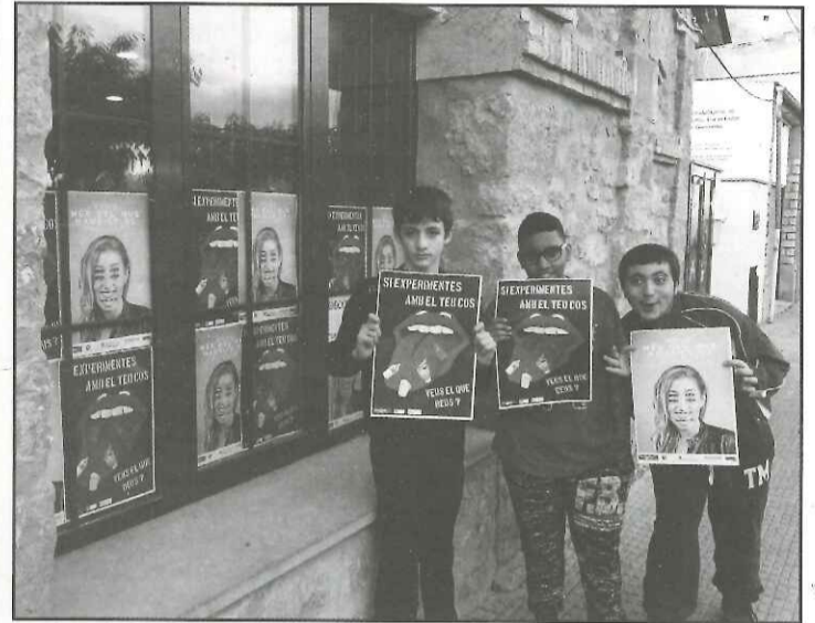
Joves del centre obert de Guissona penjant cartells a L'Escorxador

que "a la resta s'han penjat en diferents espais municipals que freqüenten els joves", segons s'ha explicat des de l'Oficina Jove, que afirma haver constatat que en diferents espais juvenils de la comarca, els joves continuen fent els cada cop més habituals "botellons". Per això, l'Oficina Jove ha ideat uns cartells sota el lema "Si experimentes amb el teu cos, veus el que beus" i a partir d'aquesta campanya, "aconseguir que els joves prenguin consciència de la problemàtica".